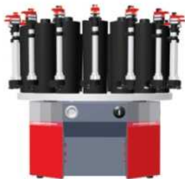
Modelo de mesa